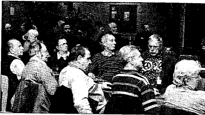
Weiterer Schritt vorwärts: Bei einer Eigentümerversammlung zur Flurbereinigung am Heppenheimer Schlossberg wurden am Dienstagabend im Hotel „Halber Mond“ zwar viele Fragen zum Ablauf und zu den Kosten gestellt, aber es wurden keine gravierenden Bedenken gegen die Neuordnung vorgebracht.

Die Kreisstadt hat ihr Scherlein dazu beigetragen, dass die Finanzierung gesichert ist. Wie