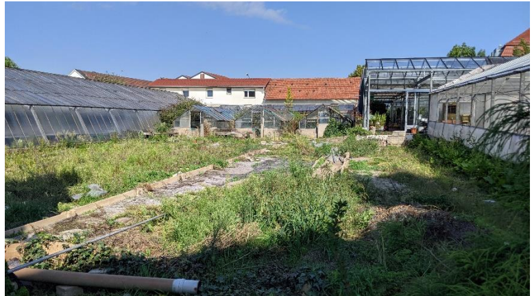
Abbildung 4: Aufgegebener Gewächshausstandort, Blick von Breslauer Straße

09.123 Artenarme Ruderalvegetation, hier: aufgegebener Gewächshausstandort