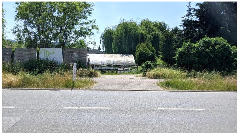
Abbildung 5: Einfahrtbereich Bürgermeister-Kunz-Straße

10.510 Völlig versiegelte Fläche, hier: Verkehrsflächen der Bürgermeister-Kunz-Straße mit Einfahrtbereich zum Gärtnereregelände