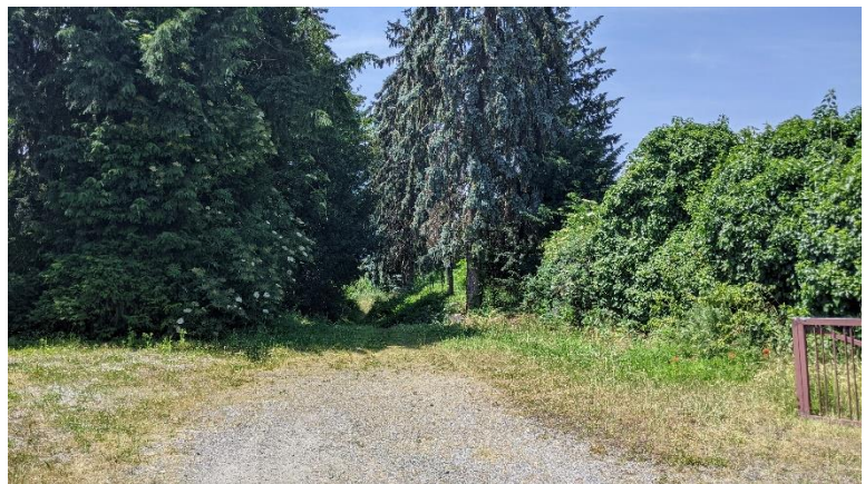
Abbildung 2: Blick von Einfahrtbereich Bürgermeister-Kunz-Straße nach Süden

09.123 Artenarme Ruderalvegetation, hier: ehemaliger Gewächshausstandort mit dominierendem Aufwuchs von Stachel-Lattich