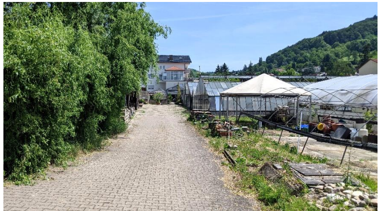
Abbildung 6: Private Wegeflächen

10.530 Versiegelte Fläche mit Regenwasserversickerung, hier: Pflasterflächen