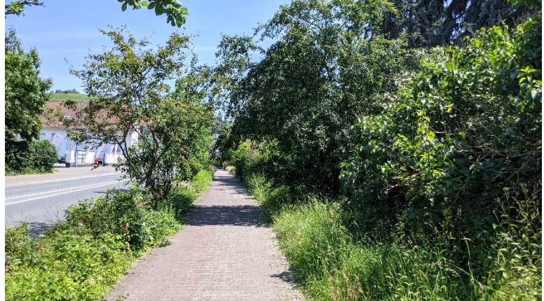
Abbildung 1: Südseite der Bürgermeister-Kunz-Straße

11.221 Gärtnerisch gepflegte Anlagen, hier: Straßenbegleitgrün