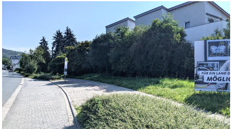
Abbildung 10: Verkehrsflächen der Bürgermeister-Kunz-Straße im Nordwesten des Plangebiets

10.710 Gebäudebestand im Nord- westen des Plangebiets