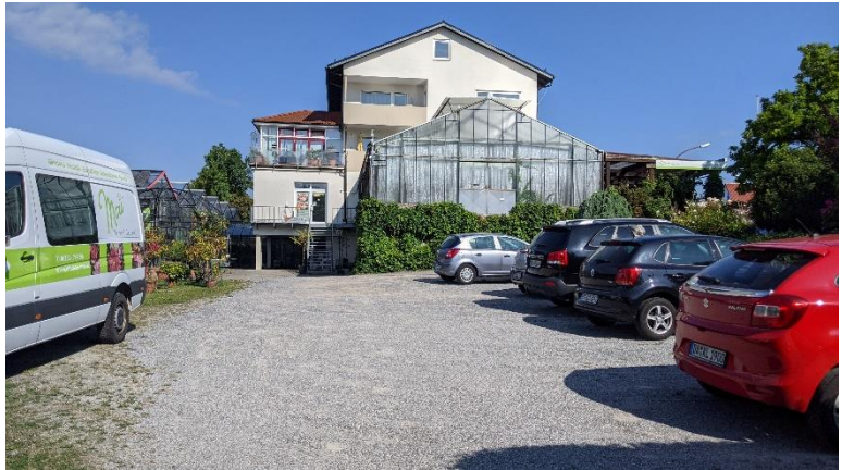
Abbildung 7: Stellplatzflächen und Hauptgebäude der Gärtnerei im Osten des Plangebiets

10.710 Gebäude Bestand, hier: Darmstädter Straße (B3)