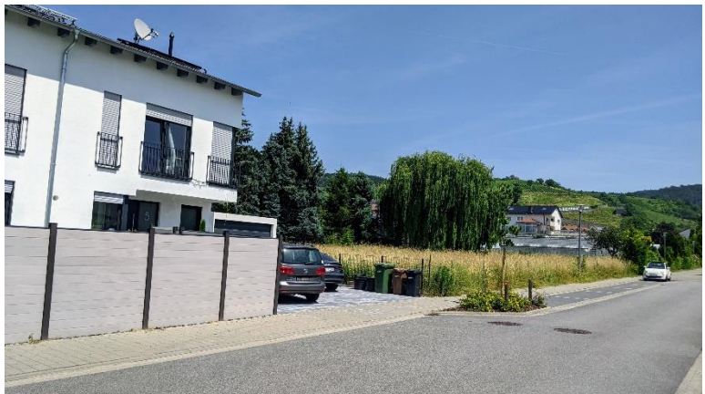
Abbildung 9: Wiesenfläche und Gebäudebestand im Südwesten des Plangebiets

10.710 Gebäudebestand im Süd- westen des Plangebiets