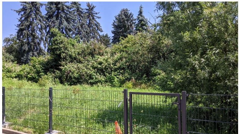
Abbildung 11: Wiesenfläche im Nordwesten des Plangebiets

11.225 Wiesen im besiedelten Bereich mit umgebenden Laubge- hölzen und Koniferenreihe im Hintergrund