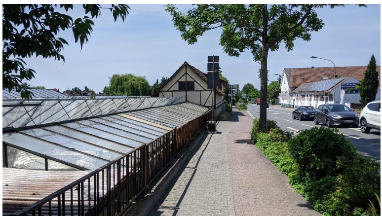
Abbildung 8: Gewächshäuser und Gebäude im Norden des Plangebiets

10.710 Gebäude Bestand hier: Bürgermeister-Kunz-Straße