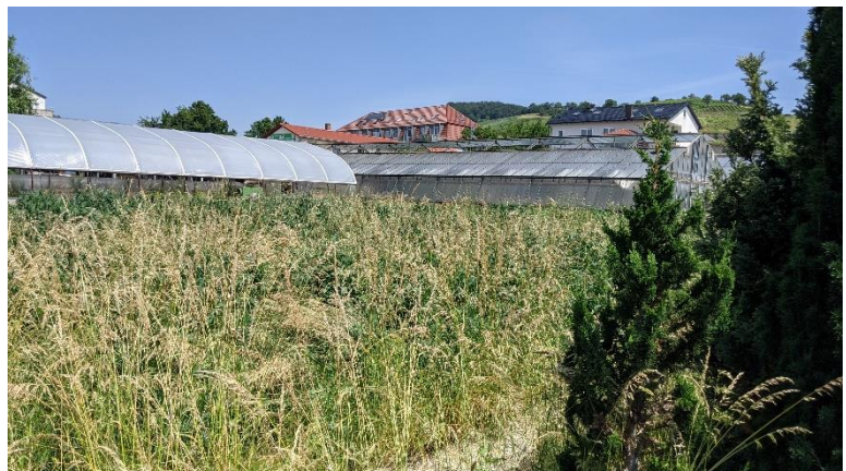
Abbildung 3: Ehemaliger Gewächshausstandort, Blick von Breslauer Straße

09.123 Artenarme Ruderalvegetation, hier: ehemaliger Gewächshausstandort mit dominierendem Aufwuchs von Stachel-Lattich