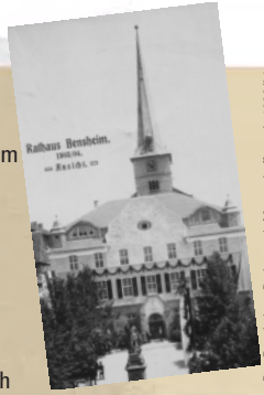
Das Bensheimer Rathaus mit Metzendorffassade 1903/04