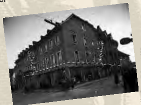
Kaufhaus Krämer 1957