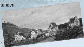
Das Höhnsche Villenviertel um 1900

Veranstalter: Magistrat der Kreisstadt Heppenheim und Metzendorf-Gesellschaft e.V.